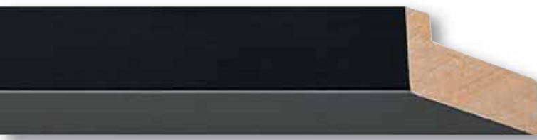
Edition 15, Linde schwarz lackiert