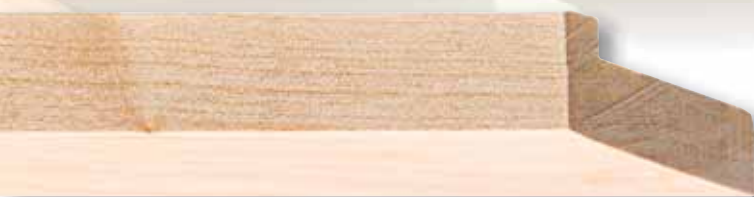
Edition 15, Birke klar lackiert