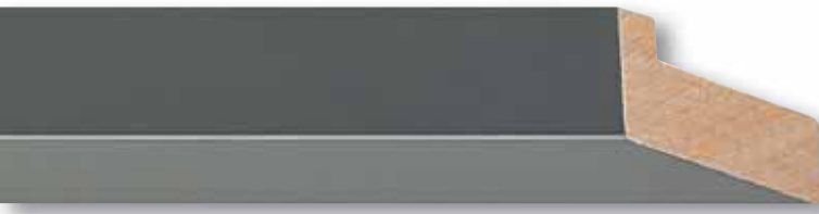
Edition 15, Linde grau lackiert