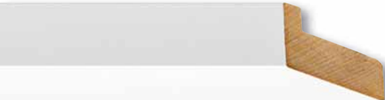
Edition 15, Linde weiss lackiert