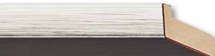
Edition 15, Silber/schwarze Aussenkante